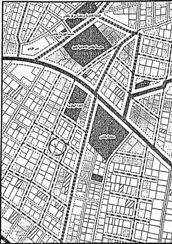
المخطط التفصيلي لمدينة بلقاس-منطقة رقم (٦)

يتم إلغاء الشارع المحدد برقم (١) بعرض (٦م)، ليتوافق مع ما هو قائم على الطبيعة حفاظاً على الملكيات الخاصة ، مع الالتزام بتطبيق الاشتراطات البنائية والتخطيطية الواردة بالمخطط التفصيلي المعتمد للمدينة وأحكام القانون رقم ١١٩ لسنة ٢٠٠٨ ولائحته التنفيذية وتعديلاتها ، وذلك بما لا يتعارض مع المخطط الاستراتيجي المعتمد للمدينة كما هو موضح بالرسم .