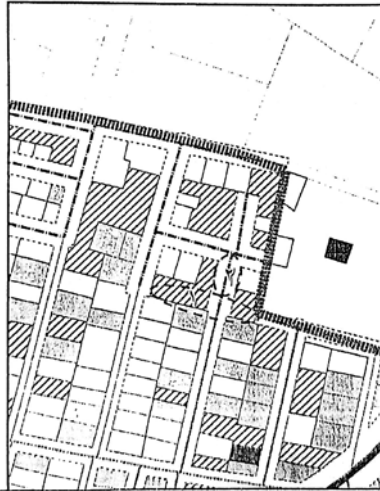
المخطط التفصيلي لمدينة بلقاس- المنطقة رقم (١)

يتم إلغاء الشارع المحدد برقم (١) بعرض (٦م) وإدراج الشارع المحدد برقم (٢) بعرض (١٠م) ، ليتوافق مع ما هو قائم على الطبيعة حفاظا على الملكيات الخاصة ، مع الالتزام بتطبيق الاشتراطات البنائية والتخطيطية الواردة بالمخطط التفصيلي المعتمد للمدينة وأحكام القانون رقم ١١٩ لسنة ٢٠٠٨ ولائحته التنفيذية وتعديلاتها ، وذلك بما لا يتعارض مع المخطط الاستراتيجي المعتمد للمدينة كما هو موضح بالرسم .