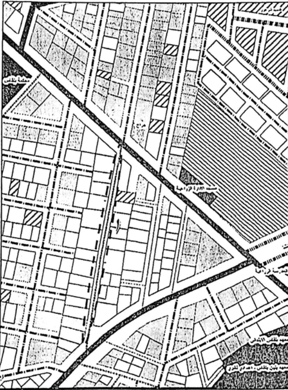
المخطط التفصيلي لمدينة بلقاس - منطقة رقم (٦)

يتم تعديل عرض شارع رقم (١) من (٦م) إلى (٨م) ، ليتوافق مع ما هو قائم على الطبيعة حفاظاً على الملكيات الخاصة ، مع الالتزام بتطبيق الاشتراطات البنائية والتخطيطية الواردة بالمخطط التفصيلي المعتمد للمدينة وأحكام القانون رقم ١١٩ لسنة ٢٠٠٨ ولائحته التنفيذية وتعديلاتها ، وذلك بما لا يتعارض مع المخطط الاستراتيجي المعتمد للمدينة كما هو موضح بالرسم .